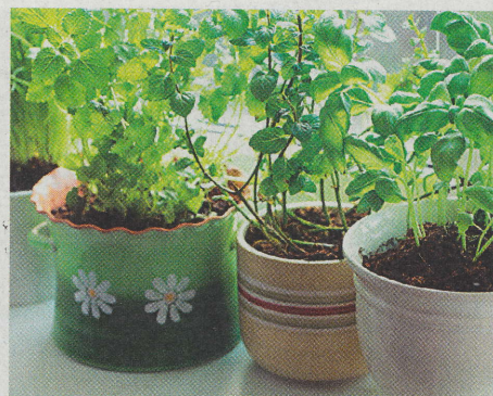
Text: Olga Trešlová